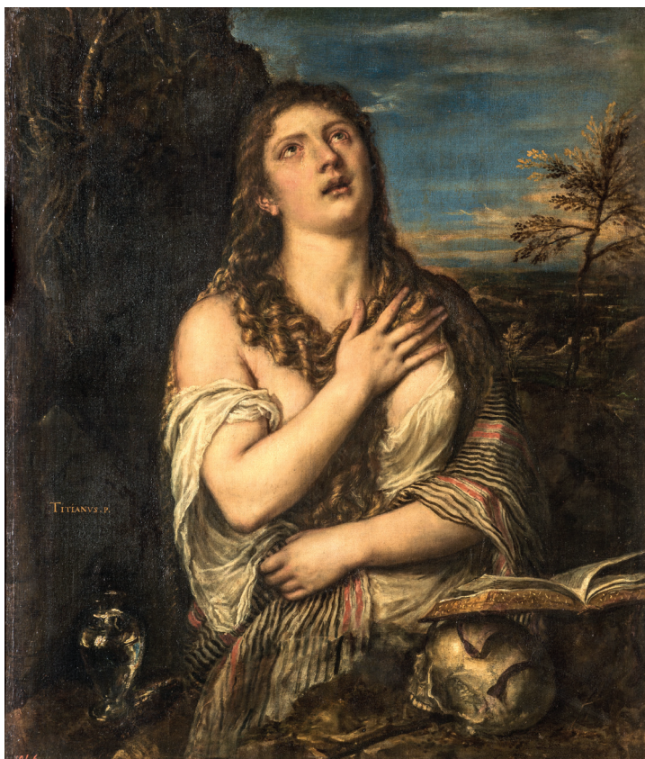
Ticiano Vecellio (Pieve di Cadore, c. 1488 - Veneza, 1576)

Considerada a sua mais conseguida representação de Maria Madalena – fiel seguidora de Cristo, referida nos quatro evangelhos canónicos como a primeira testemunha da Ressurreição e transformada, em alguns dos Testamentos Apócrifos, em pecadora penitente – esta tela integra um avultado conjunto de peças dedicadas a um tema caro ao pintor, conhecendo-se muitas outras versões que realizou ao longo da carreira para os mais exigentes e exclusivos colecionadores do seu tempo. Desde logo, a de 1531, encomendada pelo 5.º marquês e 1.º duque de Mântua, Federico Gonzaga, até àquelas enviadas a Filipe II de Espanha (1561) – e a aristocratas da corte espanhola, seus próximos, como o cardeal Granvela e o duque de Alba – ou ainda ao cardeal Alexandre Farnesio (1567), todas elas tendo como modelos longínquos um tipo iconográfico criado no círculo de Leonardo da Vinci. Uma gravura executada, em 1566, pelo gravador flamengo Cornelis Cort a partir da versão que pertenceu a Filipe II, e amplamente difundida em toda a Europa, ajudou a assegurar o sucesso das Madalenas do pintor, que se tornaram das obras mais copiadas da arte ocidental. Como se vê, reis e mecenas disputavam avidamente as produções de Ticiano, que não se fazia rogado: a familiaridade com os poderosos e um apurado sentido comercial, que alguns dos seus contemporâneos tomaram mesmo por ganância, fizeram dele um artista rico e um artista cortesão, eloquente exemplo de uma das mais características figuras do Renascimento italiano.