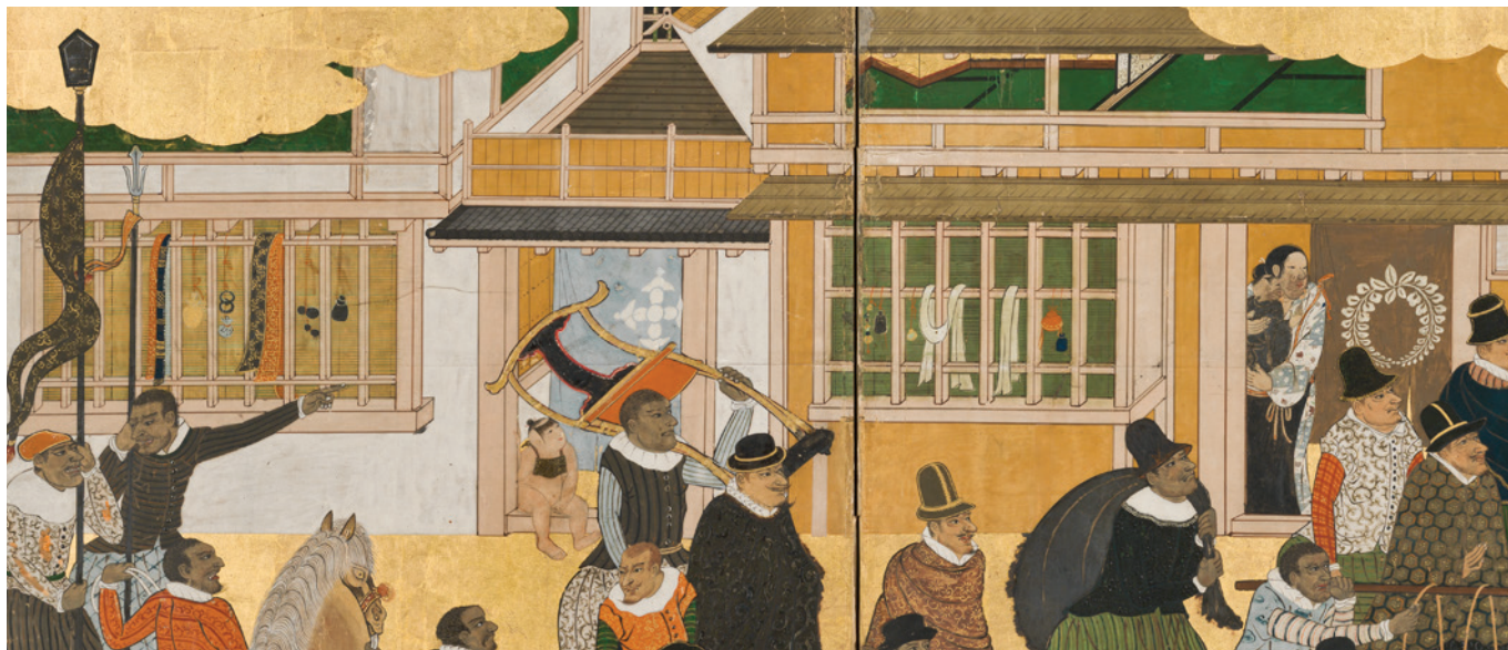
Biombo Namban (porm.), atrib. Kano Domi, Japão, 1593-1602, inv. 1640 Mov