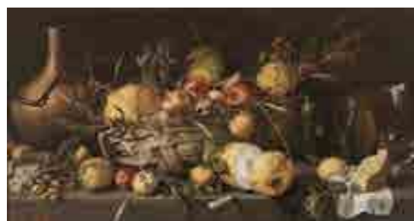
Antonio Pereda y Salgado Natureza-morta com Cesto de Frutos c. 1620-1640 MNAA Sala 57