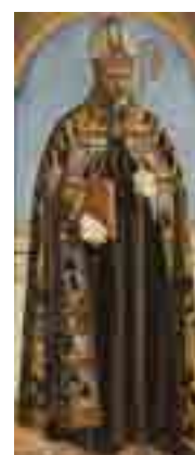
Pierro della Francesca Santo Agostinho c. 1465 MNAA Sala 63