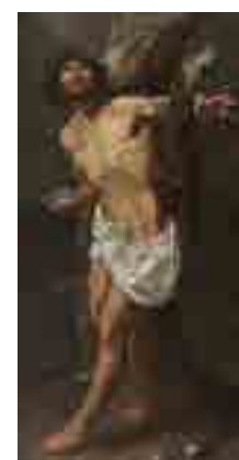
Mestre Desconhecido (Espanha?) São Sebastião c. 1625-1650 MNAA Sala 58