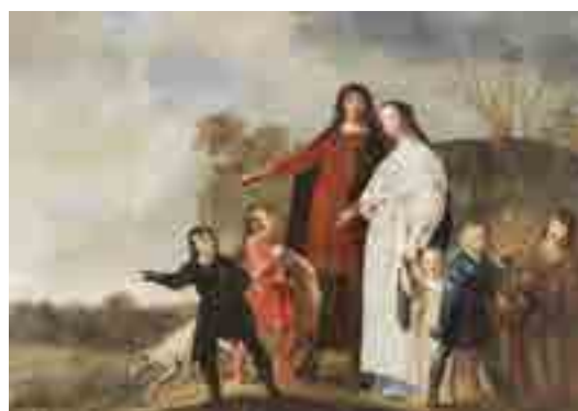
Pieter de Grebber Grupo Familiar c. 1630 MNAА Sala 57