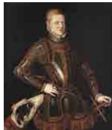
Cristóvão de Morais Retrato do Rei D. Sebastião c. 1571 MNAA Sala 13