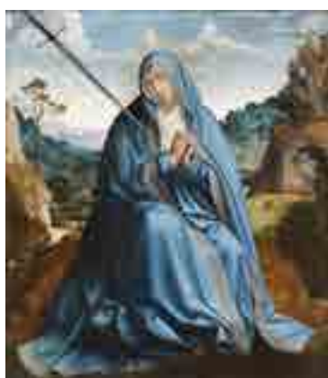
Quentin Metsys Senhora das Dores c. 1511 MNAA Sala 62