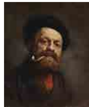
Gustave Courbet Homem do Cachimbo c. 1850 MNAА Sala 51