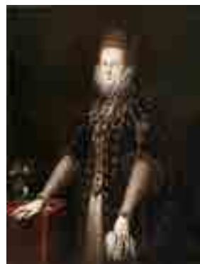
Jacopo Ligozzi Retrato de Margarida Gonzaga 1593 MNAА Sala 59