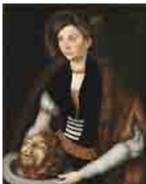
Lucas Cranach, o Velho Salomé com a Cabeça de São João Baptista 1510-1515 MNAА Sala 61