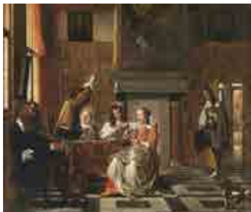
Pieter de Hooch Conversaço 1663-1665 MNAА Sala 54