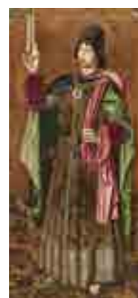
Bartolomé Bermejo São Damião c. 1460-1470 MNAA Sala 64