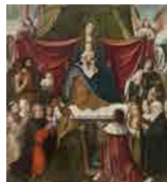
Jan Provoost Triptico de Nossa Senhora da Misericórdia (painel central) c. 1512-1515 MNAA Sala 64