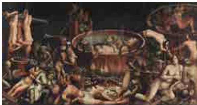
Mestre Português Desconhecido Inferno c. 1510-1520 MNAA Sala 13