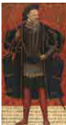
Autor Desconhecido Retrato de D. Francisco de Almeida Após 1545 MNAA Sala 17