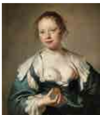
Jacob Adriaenz Backer Cortesã 1630-1650 MNAА Sala 54