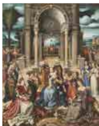
Hans Holbein, o Velho Virgem com o Menino e Santos 1519 MNAA Sala 61