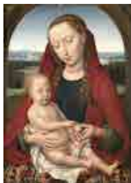
Hans Memling Virgem e o Menino c. 1485 MNAA Sala 64