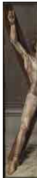
Nuno Gonçalves Martírio de São Vicente numa Cruz em Aspa c. 1470 MNAА Sala 12