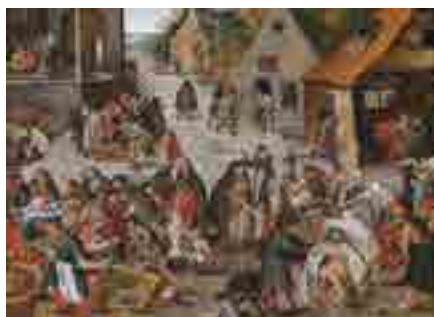
Peter Brueghel, o Jovem Obras de Misericórdia 1600-1625 MNAA Sala 56