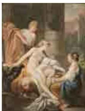
François Boucher David e Betsabé c. 1750 (?) MNAА Sala 67