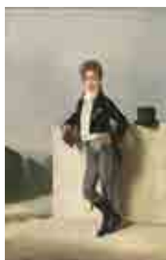
Domingos António de Sequeira Retrato do Conde de Farrobo 1813 MNAА Sala 13