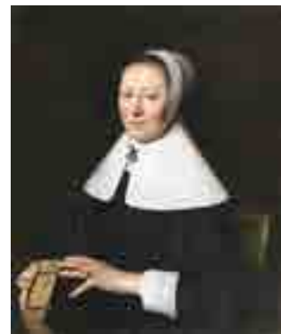
Pieter Nason Retrato de Senhora 1655 MNAА Sala 60