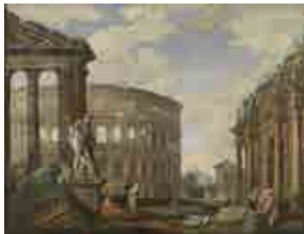
Giovanni Paolo Pannini Ruínas de Roma Antiga 1725-1750 MNAА Sala 52