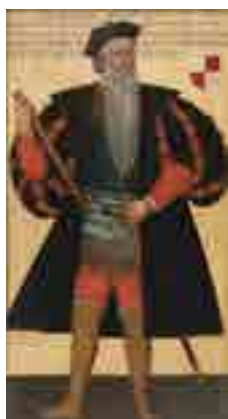
Autor Desconhecido Retrato de Afonso de Albuquerque Após 1545 MNAA Sala 17