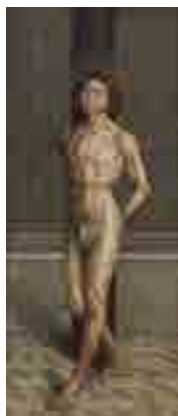
Nuno Gonçalves Martírio de São Vicente Atado à Coluna c. 1470 MNAA Sala 12