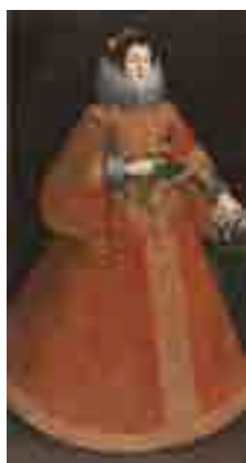
Mestre Ibérico Desconhecido Retrato de Senhora c. 1620-1640 MNAA Sala 13