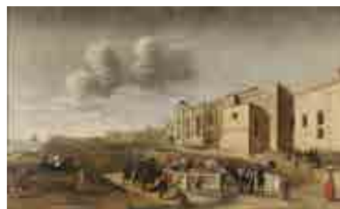
Filipe Lobo Visão Panorâmica do Mosteiro e Praia de Belém 1657 MNAА Sala 13