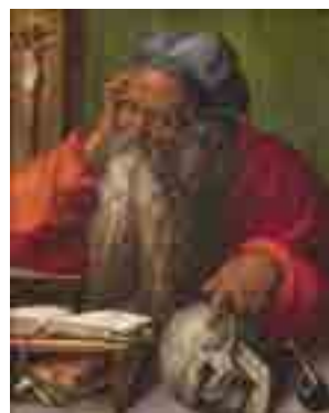
Albrecht Dürer São Jerónimo 1521 MNAA Sala 61