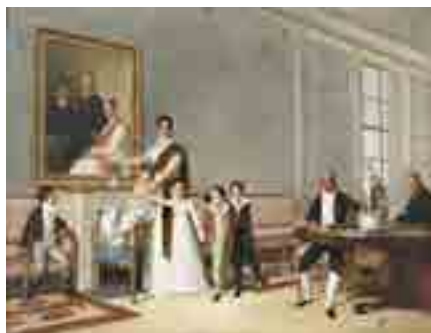
Domingos António de Sequeira Retrato da Família do 1º Visconde de Santarém 1816 MNAА Sala 13