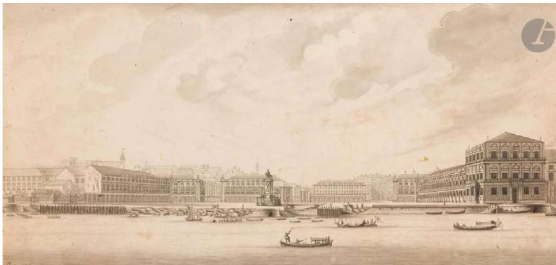
Charles Percier (1764-1838), atrib. Vista da Praça do Comércio, assinado e datado: «Percier 1796», pena, nanquim e aguada cinza sobre papel, 20,5 × 42,8 cm

O reverso da peça revela-se digno de nota, apresentando uma grinalda de flores executadas em cabelo que envolve, ao centro, uma urna – elemento iconográfico característico do repertório funerário neoclássico