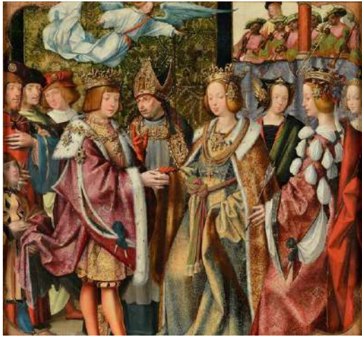
Cristóvão de Figueiredo (ativo 1515-1555), atrib. Retábulo de Santa Aua: Casamento de Santa Úrsula com o Príncipe Conan, 1522-1525, óleo sobre madeira, proveniência: Convento da Madre de Deus, Lisboa, 1912, MNA, inv. 1462-AR Pint