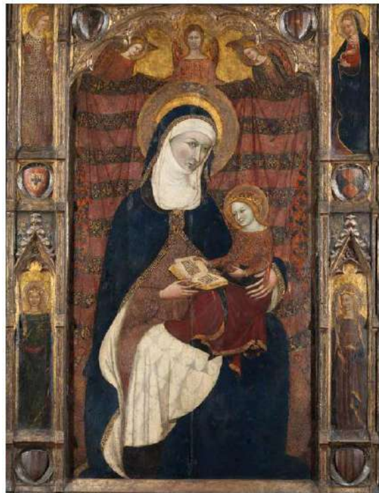
Ramon Destorrents (doc. 1351-1362), com intervenção de Ferrer Bassa (c. 1285-1348) e Arnau Bassa (c. 1320-1348), Santa Ana Ensinando a Virgem a Ler, c. 1345-1358, têmpera sobre madeira de choupo, MNA, inv. 1643 Pint

No âmbito das comemorações do V centenário do casamento do imperador Carlos V com a infanta Isabel de Portugal, um conjunto de três pinturas sobre madeira e um prato em porcelana do MNA viajam até Sevilha para integrarem a exposição temporária: Sevilla y la boda de Carlos V con Isabel de Portugal , organizada pelo ICAS – Instituto de la Cultura y las Artes del Ayuntamiento de Sevilla no Espaço Santa Clara. A mostra estará patente ao público até 30 de maio de 2026.