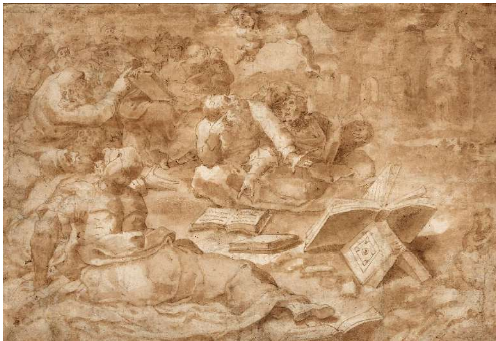
Fernão Gomes (1548-1612), A Disputa dos Doutores, c. 1590, desenho à pena a tinta castanha, aguadas castanhas e realces a guache branco, 25,8 × 20 cm

O importante núcleo de desenhos maneiristas do MNAA foi recentemente enriquecido através da aquisição em Paris de um desenho do pintor Fernão Gomes (Albuquerque, 1548-Lisboa, 1612), onde trata o tema A Disputa dos Doutores . As peculiaridades expressivas e estilizadas do seu grafismo, comuns a outros desenhos do autor, fazem deste exemplar um bom contributo para a consolidação do conhecimento da sua obra gráfica.