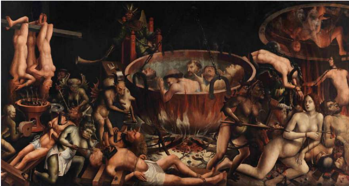
Mestre desconhecido, Inferno, 1510-1520, óleo sobre madeira de carvalho, proveniência: convento extinto em 1834, MNAA, inv. 432 Pint