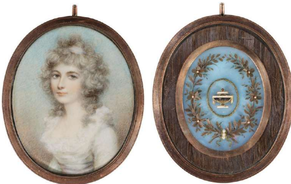
Retrato de figura feminina , Miniaturista inglês, c. 1795, Aguarela e gouache sobre marfim, 7,8 × 6,6 cm

O importante núcleo de desenhos maneiristas do MNAA foi recentemente enriquecido através da aquisição em Paris de um desenho do pintor Fernão Gomes (Albuquerque, 1548-Lisboa, 1612), onde trata o tema A Disputa dos Doutores . As peculiaridades expressivas e estilizadas do seu grafismo, comuns a outros desenhos do autor, fazem deste exemplar um bom contributo para a consolidação do conhecimento da sua obra gráfica.