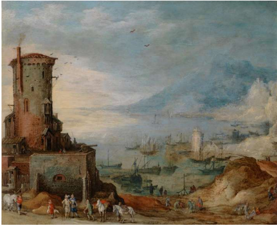
Joos de Momper II (1564-1635), Porto de mar, c. 1610, óleo sobre cobre, proveniência: Palácio das Necessidades, 1913, MNA A, inv. 1488 Pint