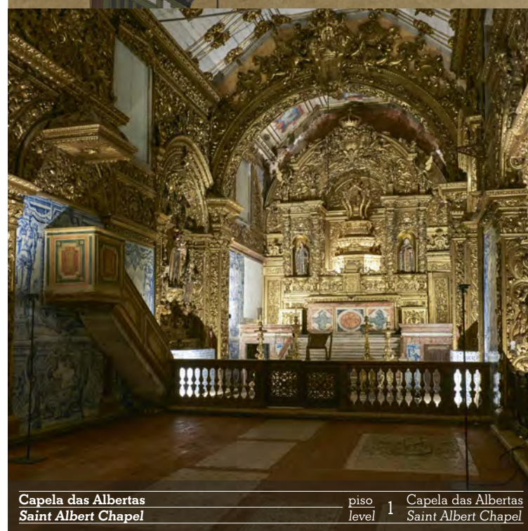
Capela das Albertas Saint Albert Chapel piso 1 sala 1 level room