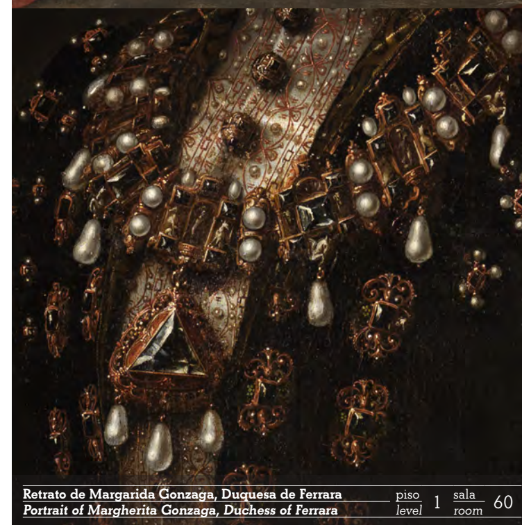
Retrato de Margarida Gonzaga, Duquesa de Ferrara Portrait of Margherita Gonzaga, Duchess of Ferrara piso 1 sala 60 level room