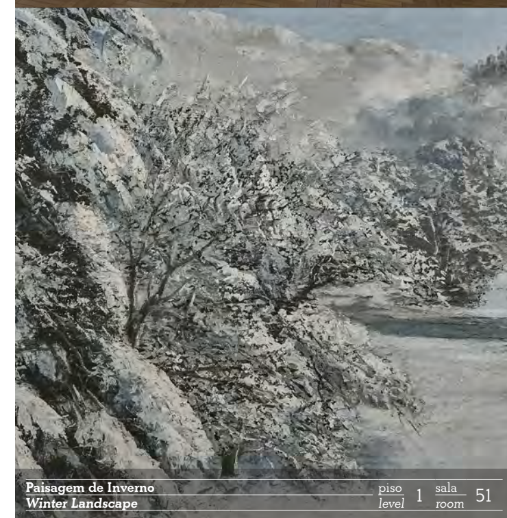
Paisagem de Inverno Winter Landscape piso 1 sala 51 level room