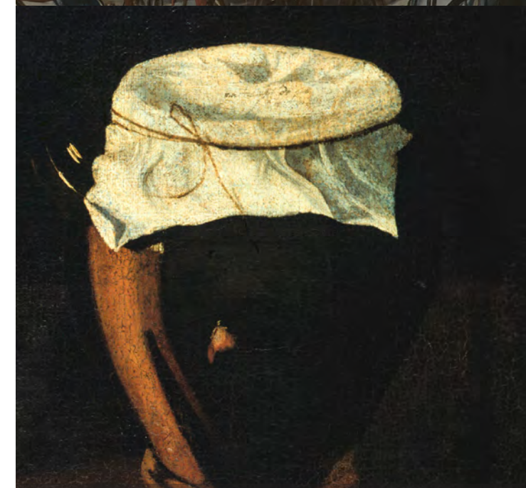
Natureza-morta com caixas e barros Still life with boxes and pottery