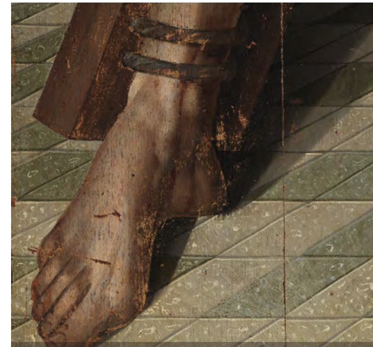
São Vicente na Cruz em Aspa St. Vincent on the Saltire Cross

DESIGNER DE SAPATOS E EMPRESÁRIO SHOE DESIGNER AND ENTREPRENEUR