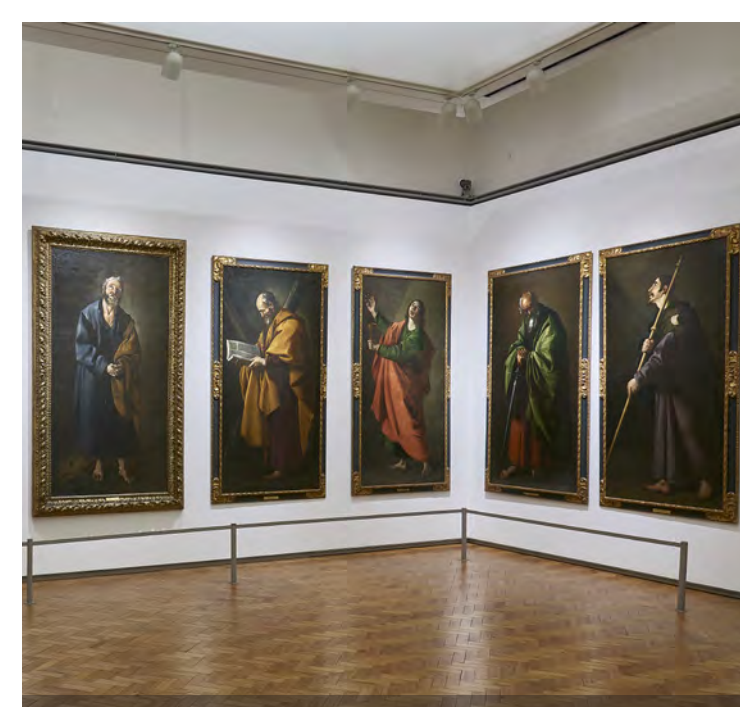
Apostolado Apostolate piso 1 sala 58 level room