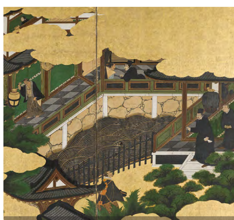
Biombos Namban Namban Folding Screens piso 2 sala 14 level room