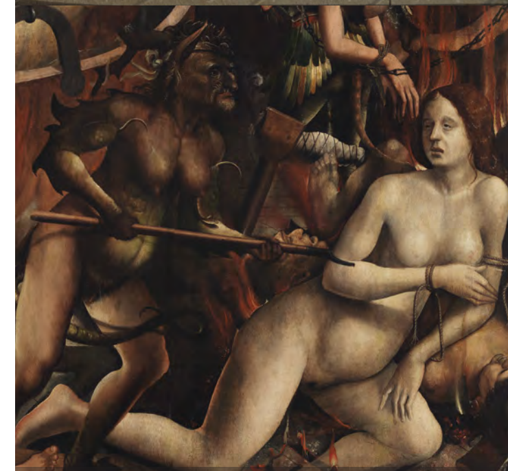
Inferno The Hell