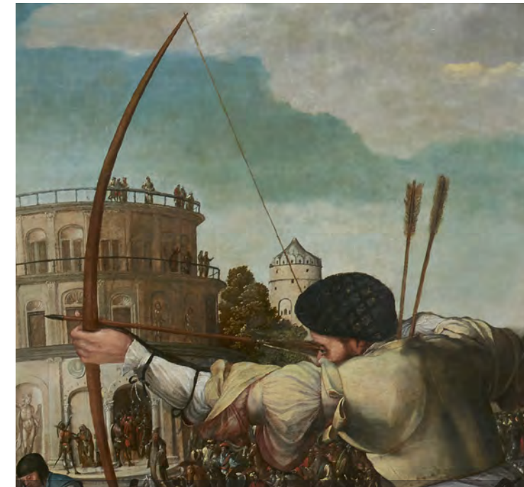
Martírio de São Sebastião The Martyrdom of St. Sebastian