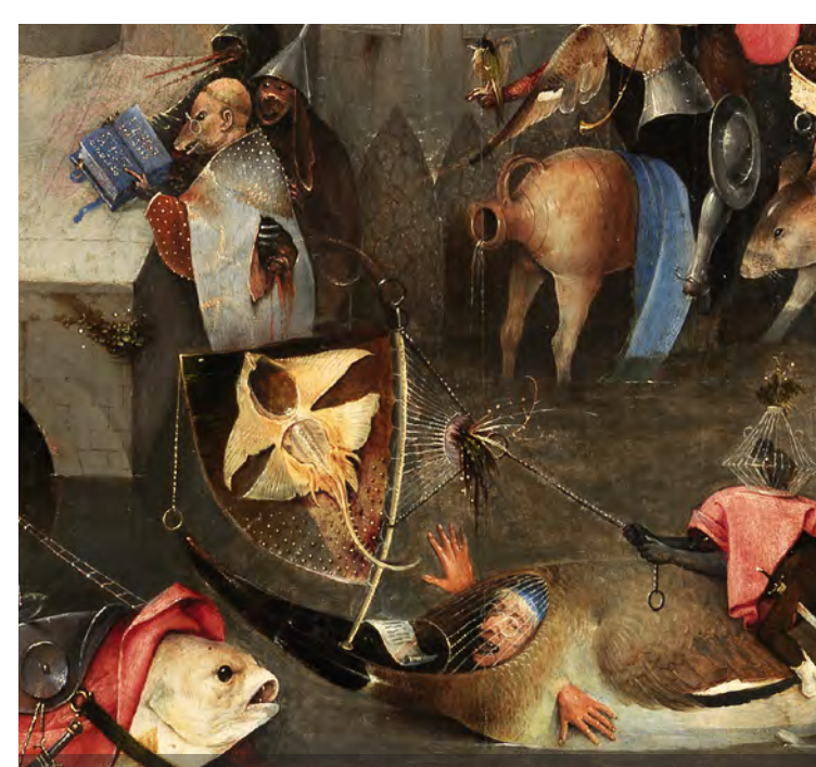
Tentações de Santo Antão The Temptations of St. Anthony Abbot piso 1 sala 61 level room